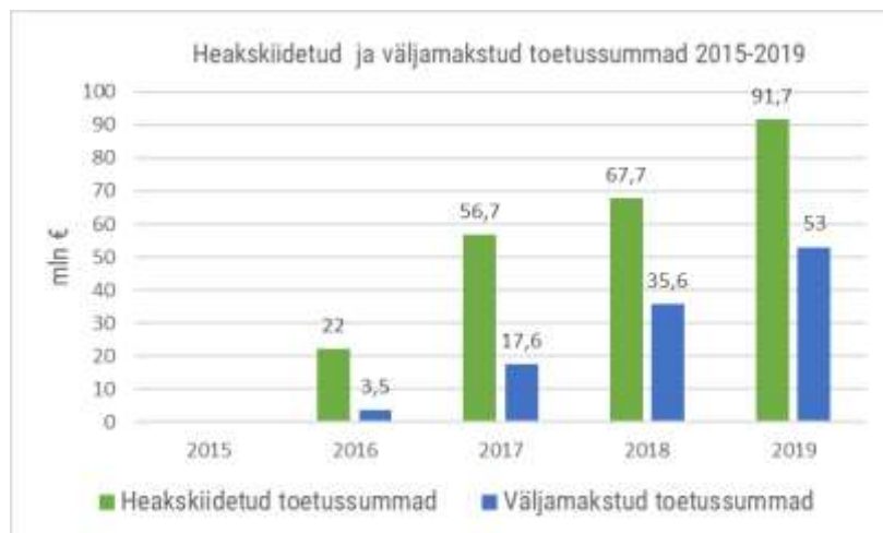
Joonis 2. EMKF 2014-2020 meetmete heakskiidetud ja väljamakstud toetussummad kokku, 2015-2019 (allikas: PRIA)

Iga-aastaselt on Eestil kohustus esitada Euroopa Komisjonile seirearuanne, milles jälgitakse Euroopa Merendus- ja Kalandusfondi 2014-2020 rakenduskava rakendamise seisu ja erinevate näitajate saavutustasemeid. See tagab, et avaliku sektori raha kulutatakse vastavalt rakenduskavas määratud tegevustele. EMKF rakenduskava 2014–2020 elluviimiseks on 31.12.2019.a seisuga rakendunud kõik prioriteetsed suunad, taotlusvoorud on toimunud 26 meetmes. 2019. aasta lõpu seisuga oli EMKF toetusi heaks kiidetud 91,7 mln € ulatuses (71% eelarvest) ning väljamakseid tehtud 53 mln € ulatuses (41% eelarvest) (joonis 2).