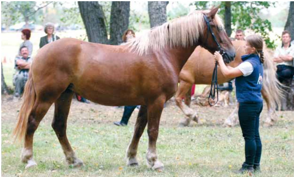
Eesti raskeveohobuste ülevaatusel.

peale turistide söidutamise sobib loom hästi just selliste soiste alade hooldamiseks, kus on traktoriga töötamine võimatu.