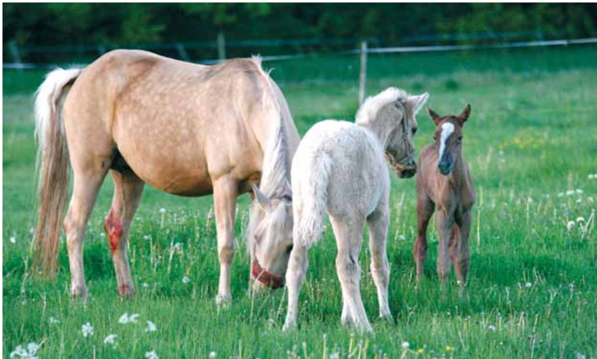
Vabapidamisel olev põlistõugu eesti hobune saab varssumisega ise hästi hakkama. Vaevalt tunnivanust varsapoissi on tulnud juba uudistama pisut vanem eakaaslane.

Alates 1980. aastatest on pandud senisest suuremat rõhku eesti hobuse ratsaspordiomaduste parandamisele. Aretustööd on saanud edu: 2005. a Eesti meister ponide takistussõidus oli eesti ristan dtäkk Anakee ning Eesti meistrivõistlustel ponide klassis kuulus kolm parimat kohta eesti hobustele.