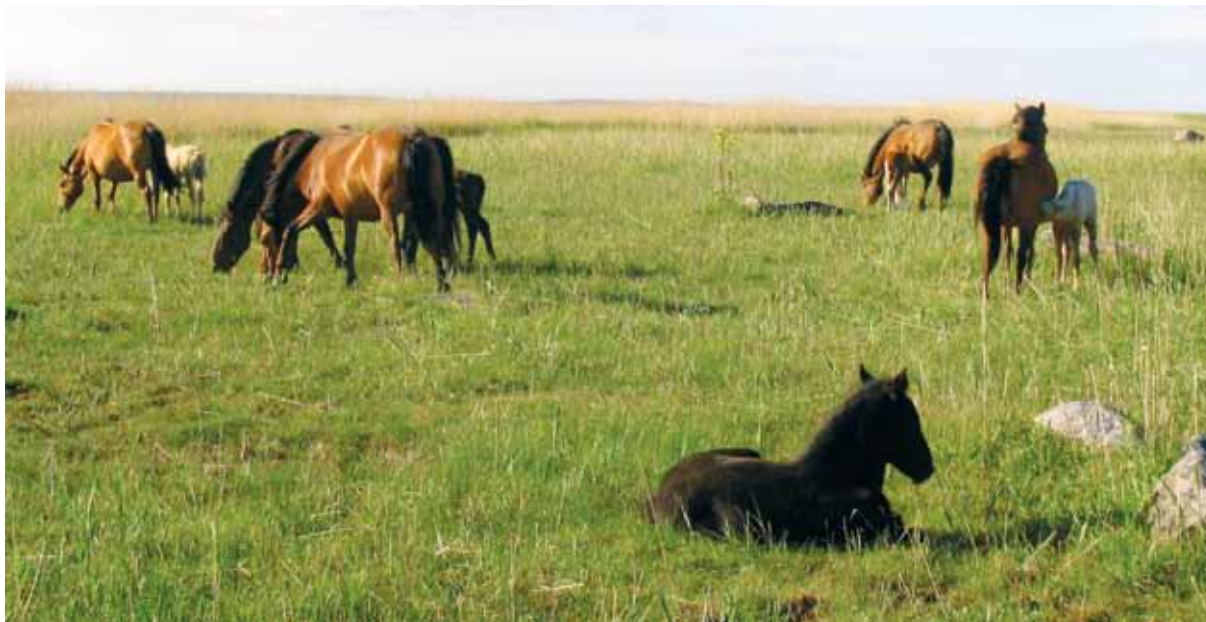
Tänapäeval on eesti hobuse hooleks poollooduslike rohumaade hooldamine. Meeleldi söövad nad rannaniidul värsket roogu ja joovad merevett.

Talletatud on legende eestlaste „dessantidest“ Rootsi, mille järgi olid eesti meestel väledad hobused paatidega kaasas. Kindlasti oli kohalikul hobusel suur tähtsus ka eestlaste muistse vabadusvõitluse juures 13. sajandil.