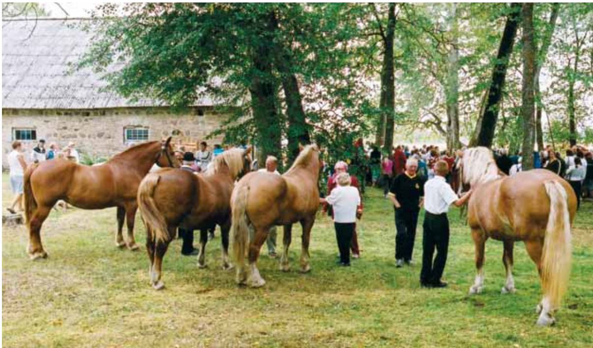
Valik märasid eesti raskeveohobuste päeval.

51 eesti ardenni täkku ja 207 mära. Tõumaterjali soetamisel oli suur tähtsus Rootsist imporditud täkkudel. Täkkude, märede ja noorhobuste impordiks sai ka riigi toetust.