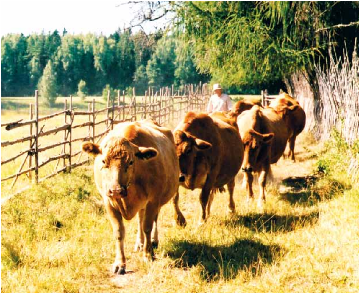
Karjamaale ja tagasi liigub kari kindlas järjekorras.