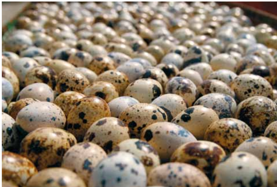
Eesti vuti munad on väga erineva värvusega.