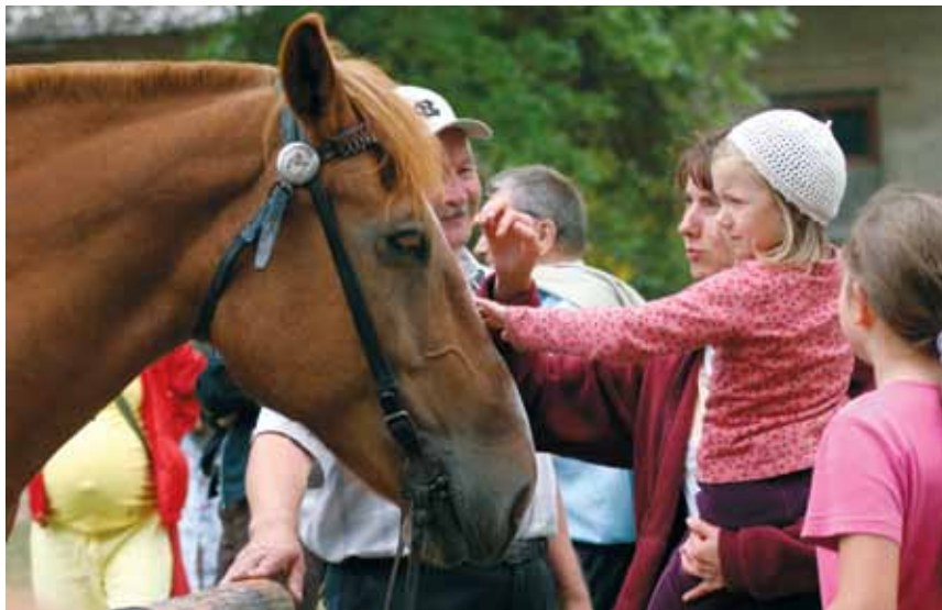
Vaatamata oma suurusele on eesti raskeveohobused väga sõbralikud ja heasoovlikud.

2003. a kevadel toimunud Eesti Hobusekasvatajate Seltsi üldkoosolekul kinnitati eesti raskeveohobuste säilitus- ja aretusprogramm. Selle eesmärk on säilitada tõug ning aretada välja mitmekülgse kasutusotstarbega tööhobune, kes vastaks nii kohalikele loodustingimustele kui majanduslikele vajadustele. Paarid valitakse nii, et säiliksid tööle iseloomulikud omadused ega tekiks lähisuguluses olevate loomade omavahelisest ristamisest tingitud puudusi – sigivuse langust ja pärilike haiguste sagenemist. Selleks tuleb laiendada tõu leviala üle kogu Eesti ning kujundada välja uusi aretusliine teiste Euroopa külmaverelist tõugu täkkudega.