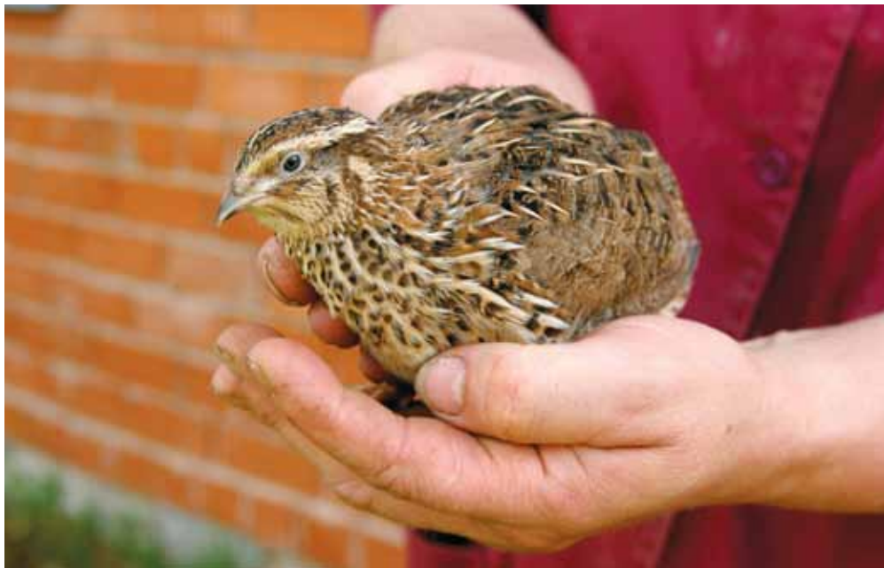
Vutt on väikseim põllumajanduslind.

päevas toodetakse seal ca 12 000 muna. Hiljaaegu avati farmis euronõuetele vastav vuttide tapamaja.