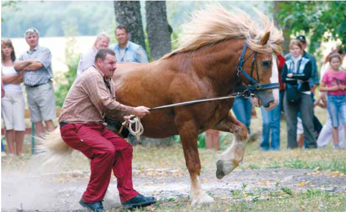
Märade läheduses hakkavad täkid käituma väga jõuliselt.

Viimaste aastate andmeid võrreldes võib loota, et raskeveohobuste arvukus hakkab tasapisi madalseisust välja tulema: kui 2003. a seisuga oli kantud tõuraamatusse 85 mära ja kuus tunnustatud sugutätku, siis kaks aastat hiljem oli märade arv tõusnud 103 loomani. Aastatega on suurenenud ka varssade arv. 2005. aastal tuli ilmale 21 eesti raskeveohobuse varssa.