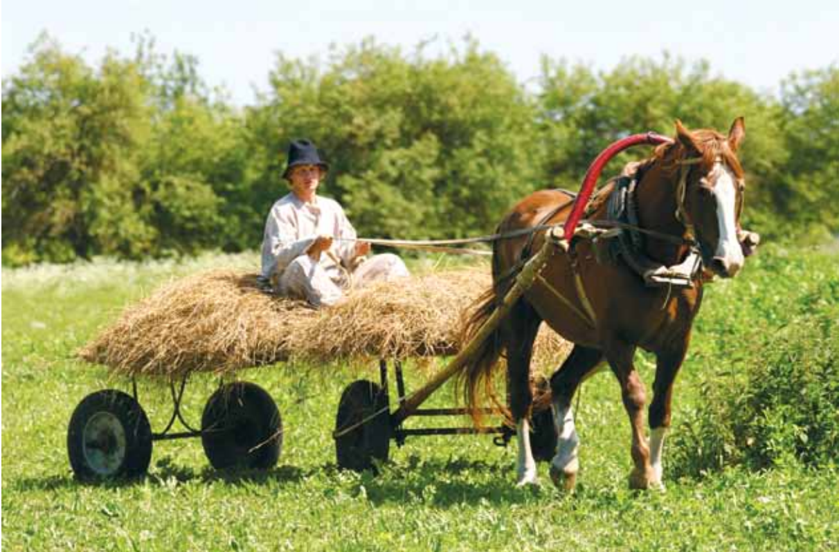
Vanatüübiline tori hobune on asendamatu abimees talutöödel.