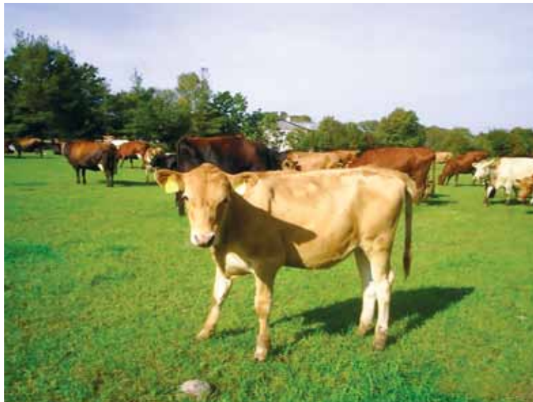
Maakarja vasikad on terved ja tugevad.

osteti läänesoome pullide spermat. 1995–2005 oli kasutusel ka 69 kodumaise pulli sperma. Nii suudeti vältida sugulusaretust ning parandada maatõu geneetilisi omadusi.