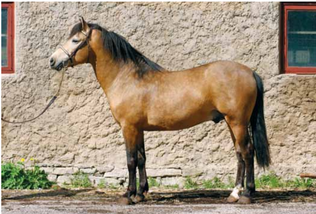
Eesti tõugu sugutäkk Rannik 747E.