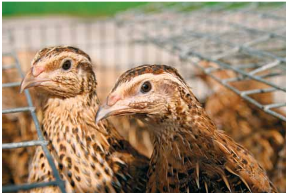
Vutte peetakse enamasti puuris.