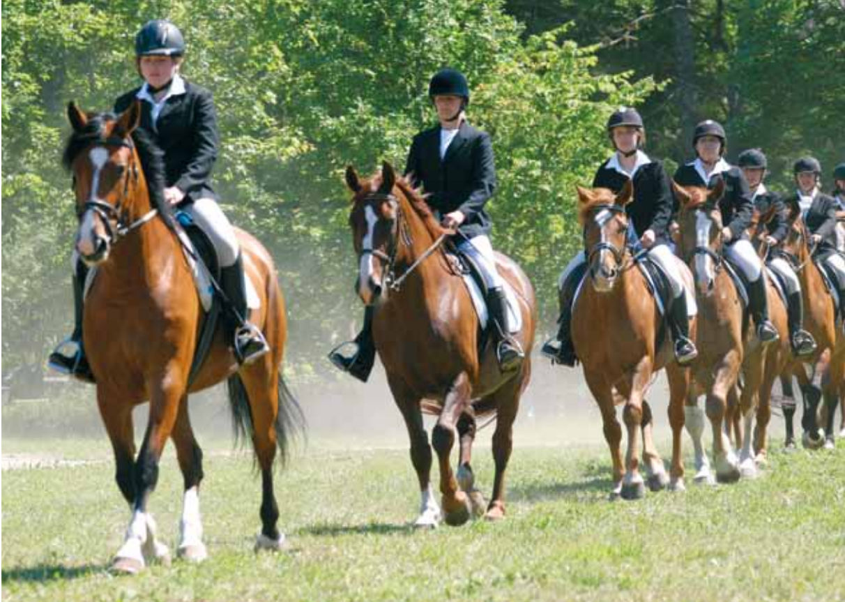
Kaasajal on tori hobust aretatud sportlikumaks.