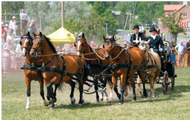
Tori hobune on suurepärase rakendihobune. Tori HK 150 aasta juubeliüritustel esitati esmakordselt kuuehobuserakendit.

Tõuloomade valikul peetakse oluliseks põlvnemist, tüüpi ja väljanägemist, liikumist, hüppeosavust, samuti tervist,