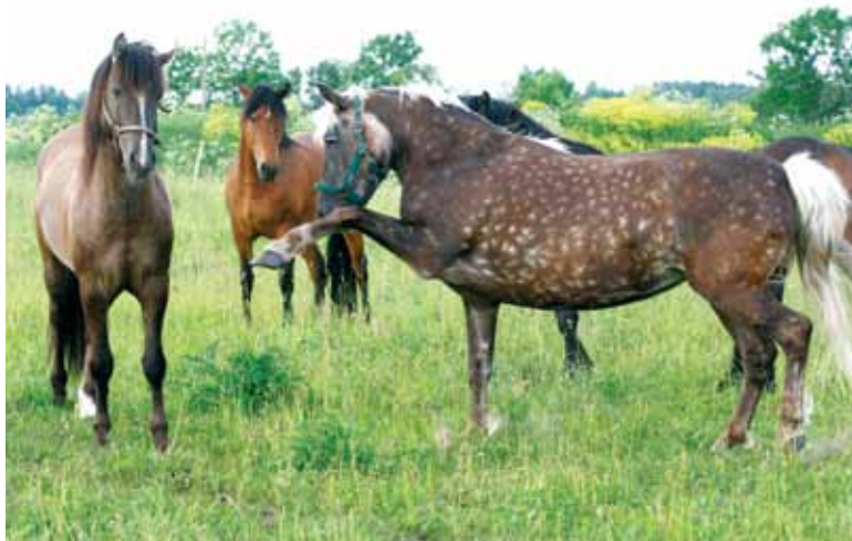
Eesti hobune on hästi värviline ja tihti leidub selles tõus väga huvitava värvusega hobuseid. Esiplaanil heleda laka ja sabaga hõbemust mära.

Tagamaks eesti hobuse püsimist Eestimaal, tema genofondi säilimist, selle hobusetõu teadvustamist ning väärtustamist, asutati 2000. aasta augustis Eesti Hobuse Kaitse Ühing. Ühing seisab eesti hobuse puhasaretuse eest, korraldab teabeüritusi ning koostab temaatilisi trükiseid.