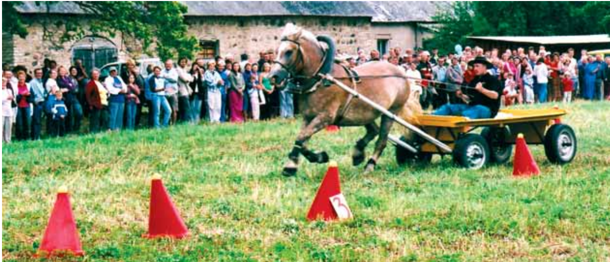
2006. a Viru-Nigulas Eesti Hobusekasvatajate Seltsi poolt korraldatud raskeveohobuste päeval oli kavas ka rakendite vigursõit.

asutamine 1911. a. Seltsi eesmärk oligi ardenni hobuste aretust süsteemselt teha. Paraku algas mõne aasta pärast Esimene maailmasõda, mis pani seltsi tegevusele punkti.